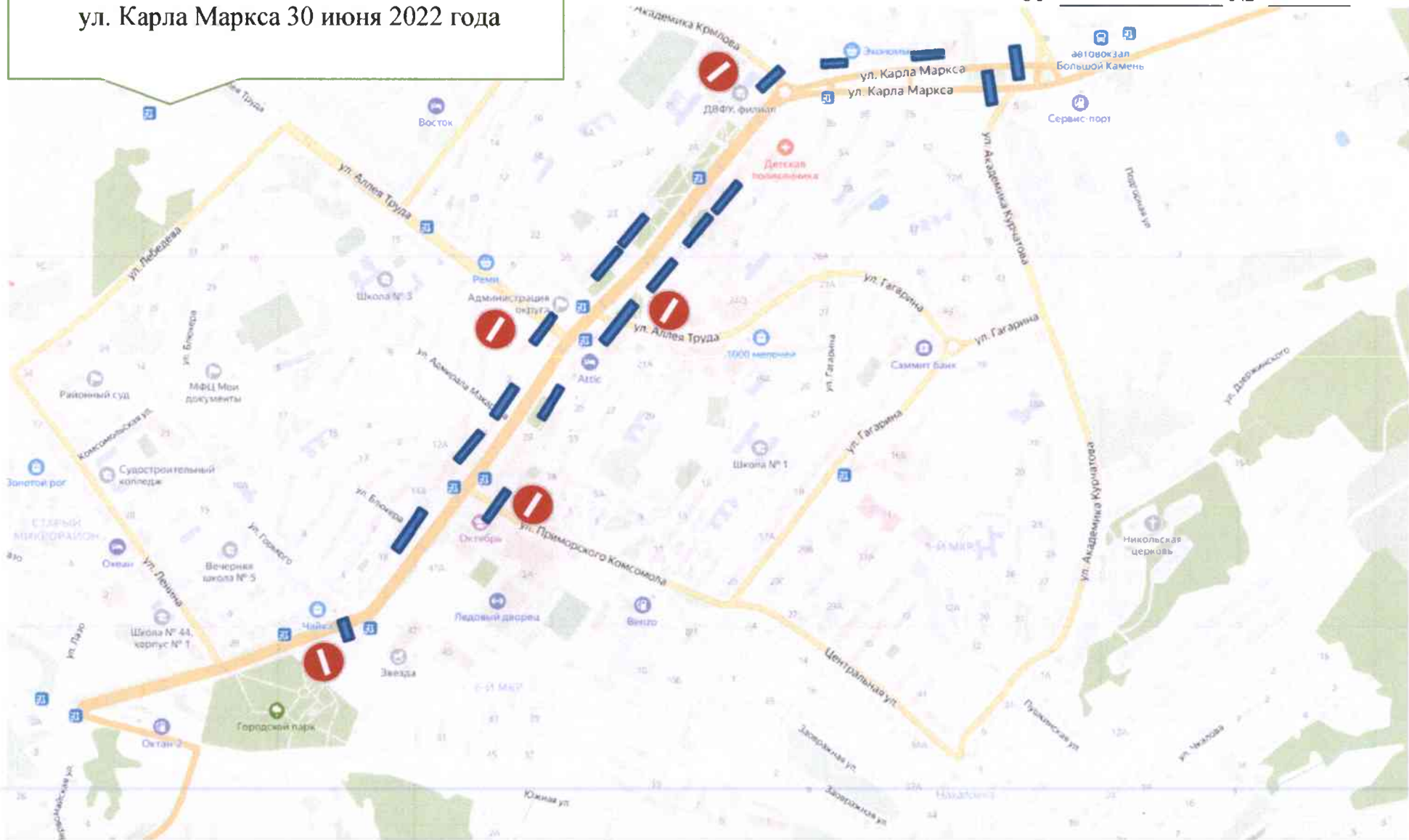
СХЕМА ограничения автомобильного движения на автомобильной дороге по ул. Карла Маркса 30 июня 2022 года