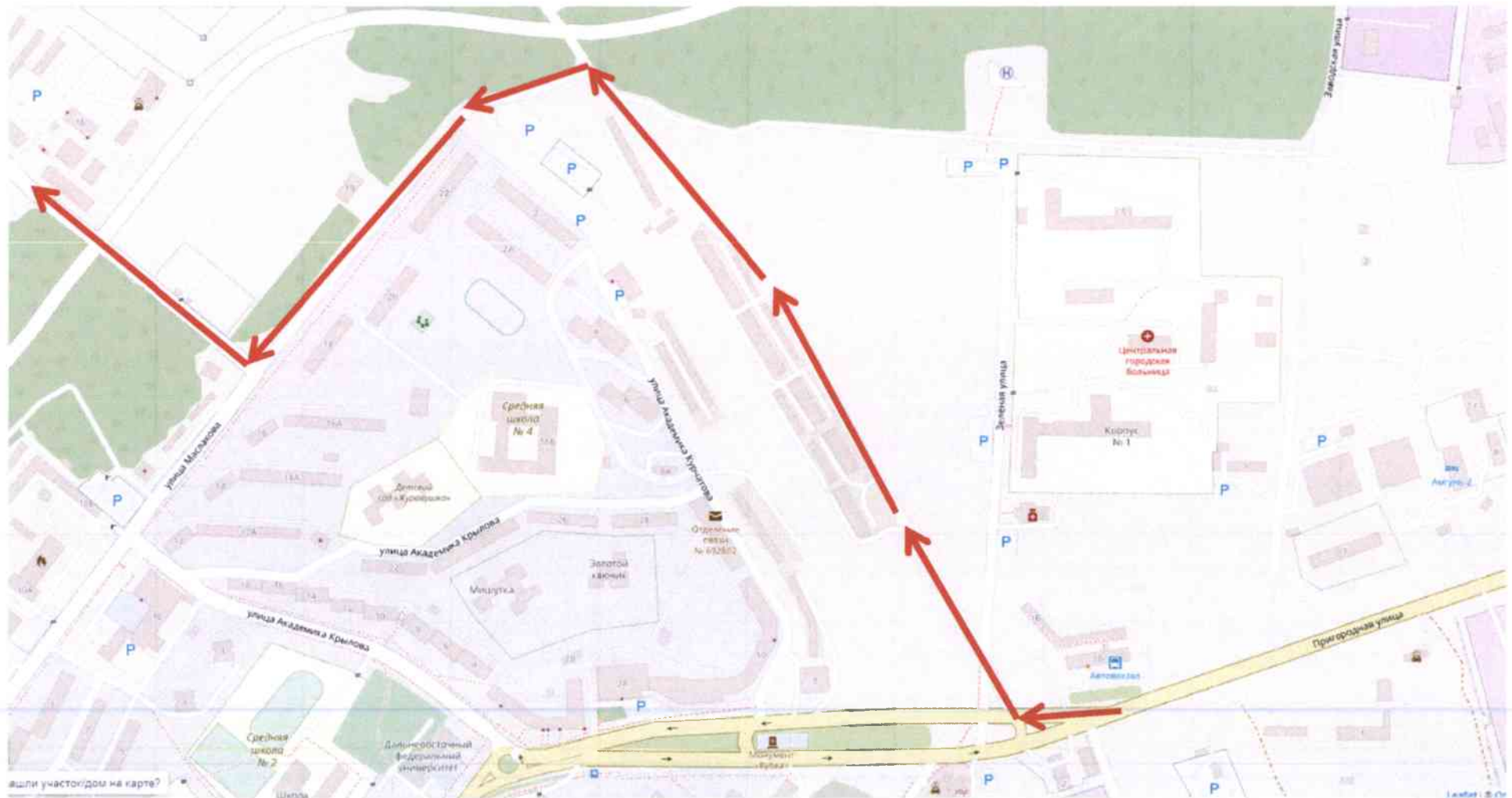
СХЕМА маршрута движения общественного транспорта по маршруту «Большой Камень – Суходол» во время ограничения движения транспортных средств на автомобильной дороге по улице Карла Маркса 30 июня 2022 года