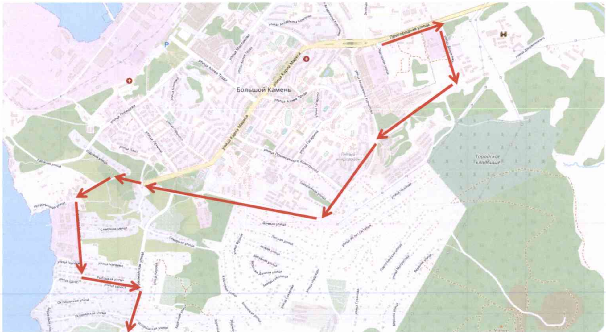
СХЕМА маршрута движения общественного транспорта по маршруту «Большой Камень – Новый Мир» во время ограничения движения транспортных средств на автомобильной дороге по улице Карла Маркса 30 июня 2022 года