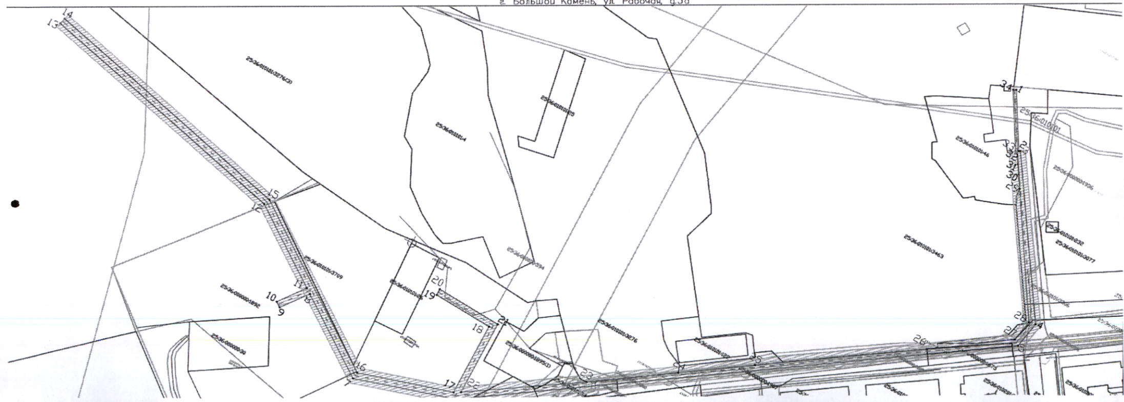
СХЕМА РАСПОЛОЖЕНИЯ ГРАНИЦ ПУБЛИЧНОГО СЕРВИТУТА Местоположение: примерно в 320м на восток от ориентира, расположенного за пределами земельного участка, адрес ориентира: Приморский край, адм. ок. городской округ ЗАТО Большой Камень, г. Большой Камень, ул. Рабочая, д.3а